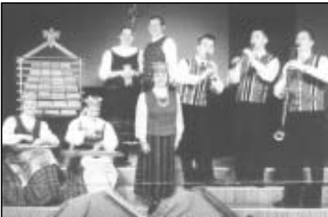
Vite aus Klaipeda in Litauen

Nach einer kurzen Besinnung und gemeinsamem Kaffeetrinken wird die Gruppe Vite aus Klaipeda in Litauen mit ihrer Musik den Nachmittag gestalten. Die acht Berufsmusiker spielen zum Teil heute selten zu hörende Instrumente aus längst vergangenen Zeiten. Damit präsentieren sie den jahrhunderte alten und heute noch lebendigen Schatz einer faszinierend-klassisch-religiösen Musik und das in ihren schönen Trachten.